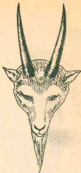
КОЗЕЛ — МИШЕНЬ ДЛЯ НАБРАСЫВАНИЯ КОЛЕЦ

Маска из папье-маше, вывернутая меховая куртка, лыжные темные штаны. На ногах, сверх ботинок, одеты тапочки, сшитые из чулка или материи, с нарисованными на них когтями и шерстью.