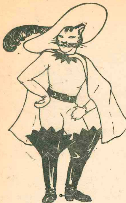
КОТ В САПОГАХ

Серый комбинезончик, на руках и ногах — мягкие лапки, сделанные из папье-маше. Хвостик шит из старого чулка, набит ватой или бумажными стружками.