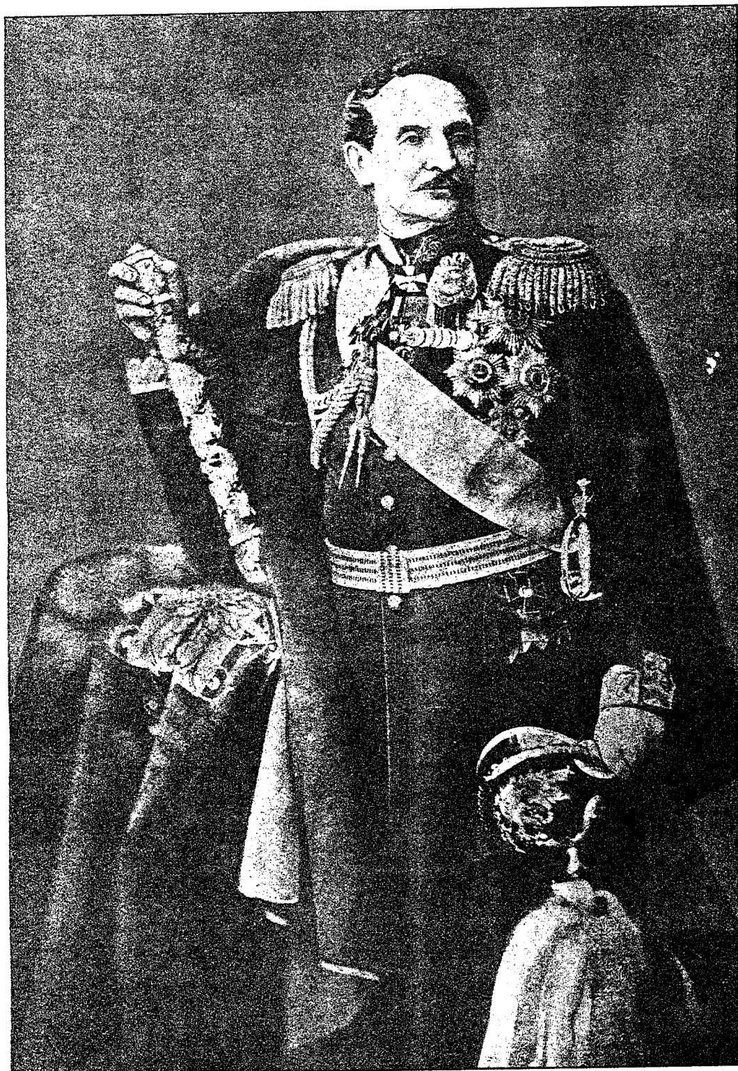
Генералъ-фельдмаршалъ графъ Бергъ. Шефъ 10-го пѣхотнаго Новоингерманландскаго полка 1868—1874 г.г.