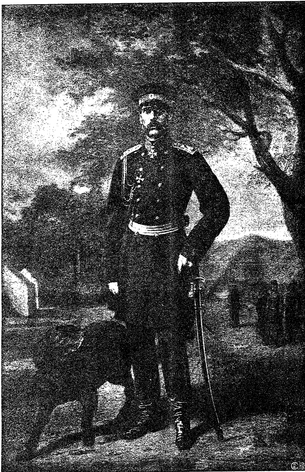
Царь—Освободитель Императоръ Александръ II-й въ Болгаріи.