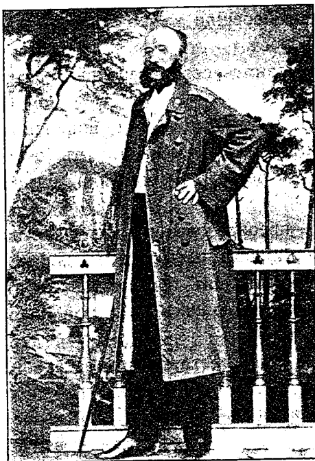
Командиръ пѣхотнаго Новоингерманландскаго полка полковникъ Насакенъ 1854—1863 г.г.

Приближался 1854-й годъ. Россія была наканунѣ войны, начало которой ожидалось съ часу на часъ: 4-го января въ полку было объявлено Высочайшее повелѣніе о прекра-