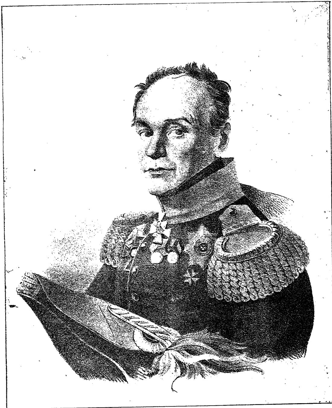
Генераль-лейтенантъ Цвиленевъ Командиръ Новоингерманландскаго пѣхотнаго полка 1806—1810 г.г.